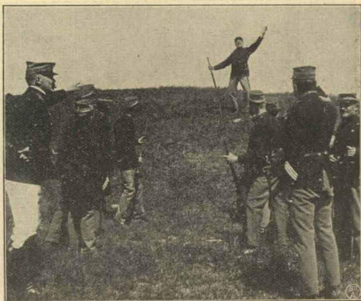
»Skansen er taget!«

I Kongens Klæ'r er alle lige. Grosserereren og Havnesjove- ren kan som Værnepligtige blive puttet ind i Geledet ved Siden af hinanden, og de faar begge Lov til at lystre den første den bedste Underkorporal uden ringeste Forsøg paa Protest eller Mukken.