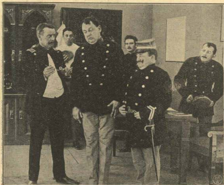
Medicin kontra Aandsevner!